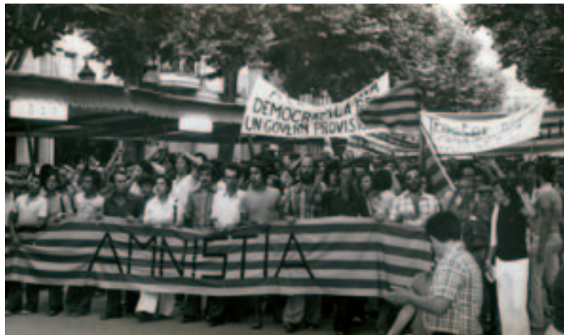
Manifestació en favor de l'Amnistia convocada per l'Assemblea Democràtica a Vilafranca del Penedès l'any 1976 (Arxiu Comarcal de l'Alt Penedès. Arxiu de la imatge i del so. Fons Tothom-Jordi Valls).