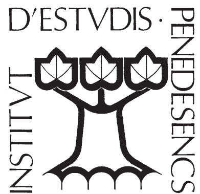
Antic logotip de l'IEP.

ral penedesenca en col·laboració amb els centres d'estudis locals, les biblioteques, els museus i els arxius penedesencs i les admi-