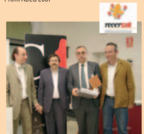
Premi Recercat 2007 de l'Institut Ramon Muntaner