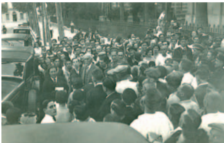
Visita de Francesc Macià a Vilanova i la Geltrú l'any 1933 (Foto: Biblioteca Víctor Balaguer).

Aquest projecte consta de diverses parts complementàries: recerca exhaustiva en base a la documentació escrita, oral, visual i patrimonial; recuperació i sistematització de fonts d'informació primàries; fer-ne una interpretació global, per tal d'analitzar-ne els trencaments i les continuïtats a nivell polític, social, econòmic, i cultural; creació d'una gran base de dades amb els noms dels protagonistes del període en un sentit molt ampli; servir, conservar i difondre el material localitzat i generat durant la recerca; planificar itineraris de la memòria democràtica a partir del patrimoni i els records; difondre i divulgar aspectes generals, temàtics o cronològics de la recerca mitjançant publicacions, audiovisuals, conferències, exposicions, itineraris, material didàctic i una gran pàgina web