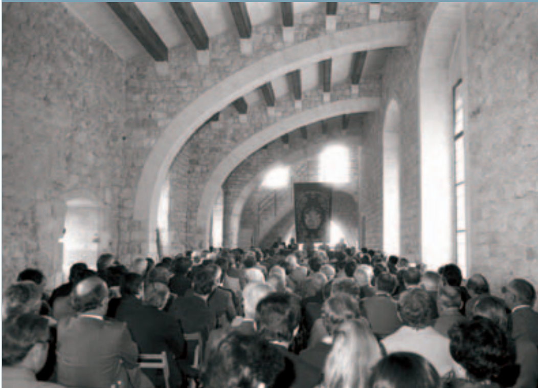
Acte de constitució de l'IEP, el 15 de maig de 1977 al castell de Sant Martí Sarroca