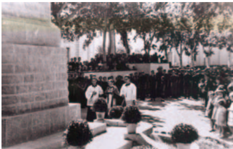
Inauguració de la "cruz de los caidos" del Vendrell, 1940.

Director del projecte Tots els Noms secretaria@totselsnoms.org